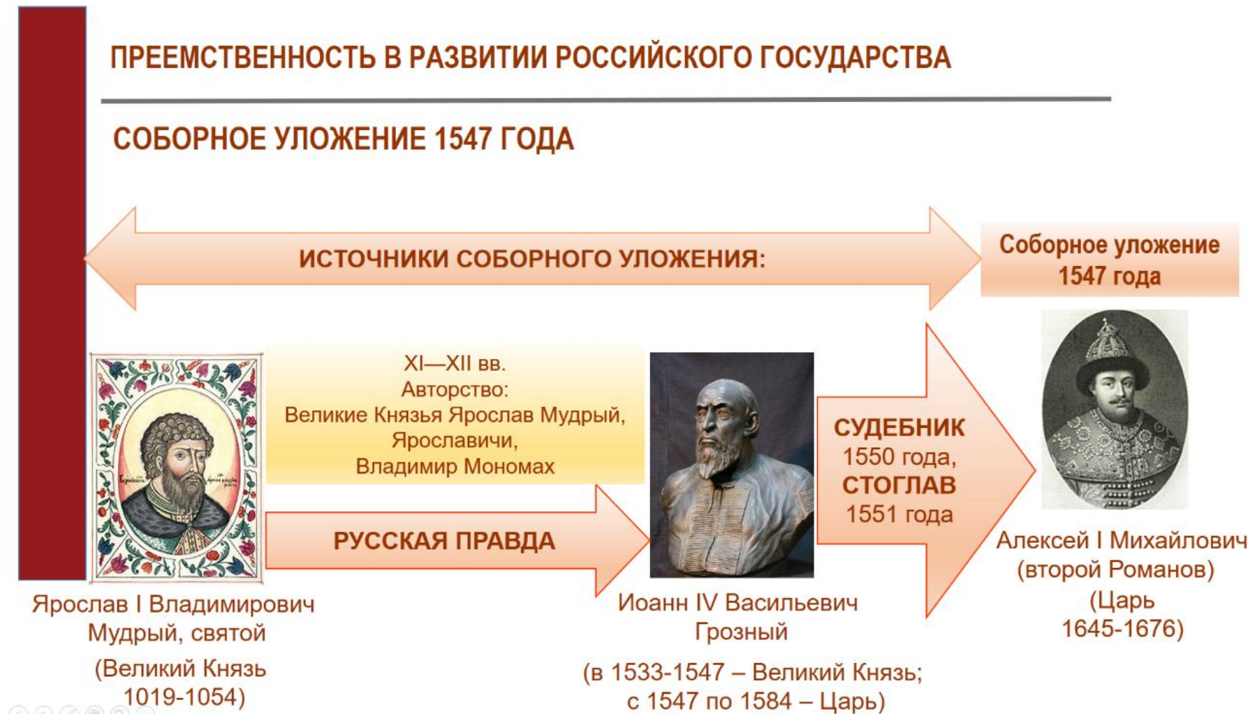
Рис. 2 Правопреемственность в истории российского государства: Соборное уложение 1547 г.