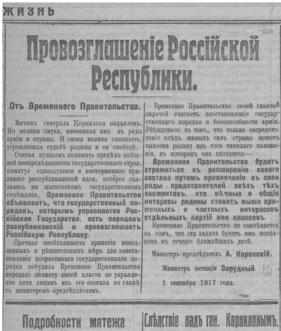
Рис. 5. Публикация постановления Временного правительства о провозглашении Россия республикой. Газета «Новая жизнь» № 2 от 3 (16) сентября 1917 года. С.3.

своей задачей оно не справилось – не только затянулся процесс юридического провозглашения республики, но и первенство в конституционном оформлении государственного устройства России было отдано большевикам.