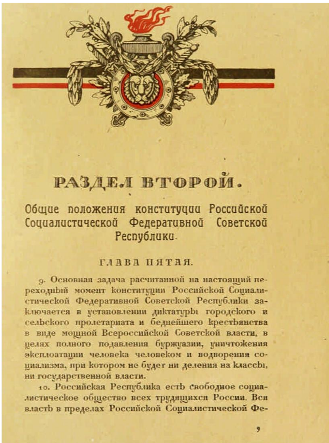
Рис. 6. Электронная копия Конституции РСФСР (1918). С.9. // // Библиотека Президента Российской Федерации. URL: https://www.prlib.ru/item/420904