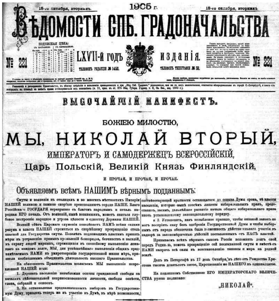
Рис. 3. Публикация Высочайшего Манифеста от 17 октября 1905 г. «Об усовершенствовании государственного порядка», в газете Ведомости № 221 от 18 октября 1905 года. // Белая гвардия. Интернет-ресурс. URL: http://rugaru.ru/books/read/Ob_usovershenstvovanii_gosudarstvennogo_porjadka.html

употребление местных языков и наречий в государственных и общественных установлениях определяется особыми законами. 82