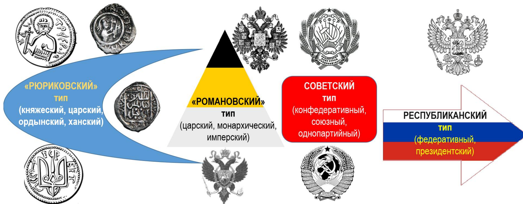
Рис. 1. Правопреемственность и типология российской государственности.