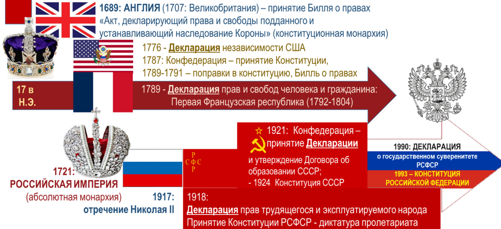
Рис. 12. К вопросу устойчивости организации национальных систем государственного управления