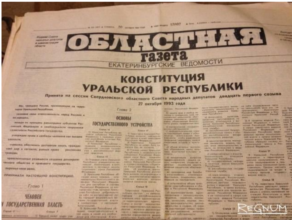
Рис. 13. Конституция Уральской республики. Фотокопия первой страницы «Областной газеты» за 30 октября 1993 года. 124

имеет исключительные права и приоритет в формировании своего бюджета.